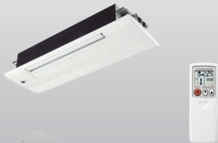
MLZ-KA25 – 50VA