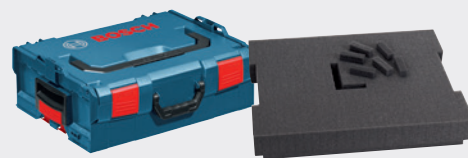
Walizka narzędziowa L-Boxx

* Szczegółowe informacje w regulaminie akcji