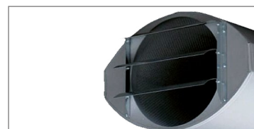
wylot-zintegrowany deflektor umożliwiający kierowanie strugą powietrza