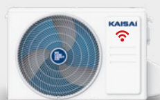
Jednostka zewnętrzna KWX