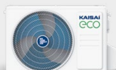
Jednostka zewnętrzna KEX